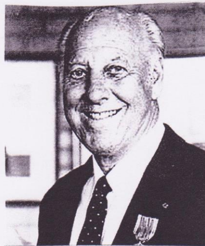
JEG VIL LËVE